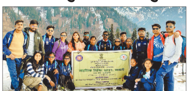
शिविर में शामिल स्वयंसेवक।