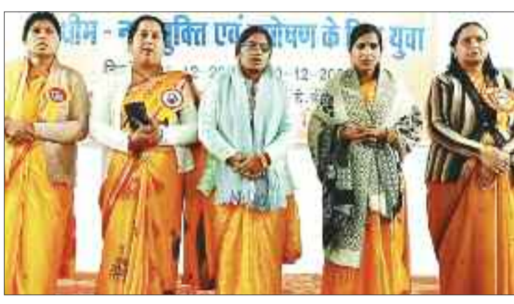
शिविर में शामिल कॉलेज की टीम।