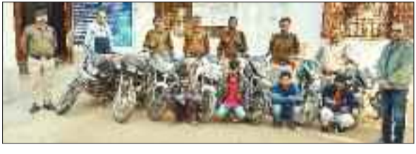
गिरफ्तार किए गए बाइक चोरों के साथ पुलिस अधिकारियों के साथ।

अम्बिकापुर। सरगुजा पुलिस ने बाइक चोरी के गिरोह को पकड़ने में सफलता हासिल की है। पुलिस ने मामले में चार आरोपियों को गिरफ्तार करने के साथ ही उनके पास से आठ नग बाइक बरामद किया है।