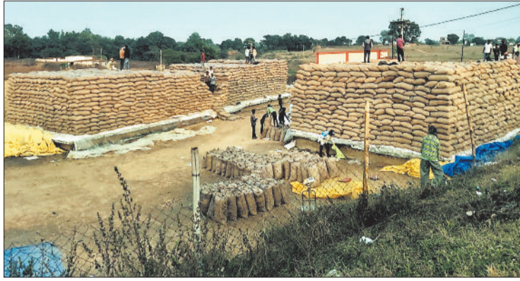
जामपारा समिति में खरीदे गए धान।

बेमौसम बरसात के बाद मौसम साफ होते ही धान खरीदी केन्द्रों में आवक बढ़ गई है। जानकारी के अनुसार अब तक कोरिया-एमसीबी के 46 उपार्जन केन्द्रों में धान खरीदी के बदले राज्य सरकार ने लगभग 23 करोड़ 67 लाख 50 हजार 716 रुपए का भुगतान कर दिया है। साफ होने के बाद पिछले कुछ दिनों में सहकारी समितियों में धान की रिकार्ड बढ़ी धान की आवक हुई। दोनों जिलों में अब तक 2259 से अधिक किसानों से करीब 108432 क्विंटल धान की खरीदी की गई, वहीं इसके बदले किसानों को 23 करोड़ से अधिक का भुगतान भी कर दिया गया है। विदित हो कि धान खरीदी 1 नवंबर से शुरू हो चुकी है, जो 31 जनवरी तक चलेगी। उल्लेखनीय है कि प्रशासन ने जिले में कुल 1 लाख 33 हजार मीट्रिक टन धान खरीदी का लक्ष्य रखा है, हालांकि अभी अगले 50 दिन तक धान खरीदी चलेगी। गौरतलब है कि जिले में बरसात बंद होने के बाद मौसम साफ होते ही किसान फिर से बचे हुए धान की कटाई और मिंजाई में लग गए हैं। धान खरीदी केन्द्रों में भी धान की आवक फिर से एक बार बढ़ने लगी है। धान खरीदी के लिए केवल 50 दिन ही बचे हैं। ऐसे में धान खरीदी के लक्ष्य को पूरा करने के लिए कड़ी मेहनत करनी पड़ेगी। कोरिया में 22 उपार्जन केन्द्र बनाए गए थे। इनमें गिरजापुर, चिरमी, जामपारा, झरनापारा, छिंदिया, तरगवां धौराटिकरा, पटना, पौड़ी, बैमा, बड़ेकलुआ, रजौली, सरभोका