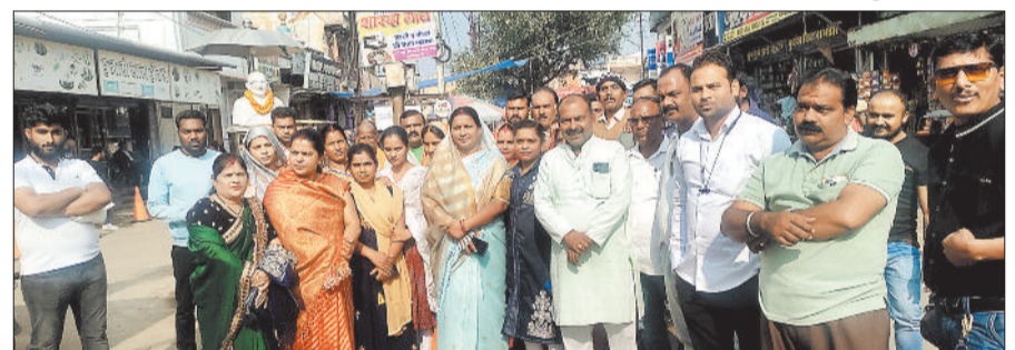
गांधी चौक पर आतिशबाजी कर जश्न मनाते समाज के लोग।

मध्यप्रदेश में भारतीय जनता पार्टी के द्वारा डॉ. मोहन यादव को मुख्यमंत्री बनाए जाने पर एमपी में मोहन यादव समाज द्वारा आतिशबाजी व मिशन वितरण कर खुशी मनाई गई। इस मौके पर यादव समाज के लोग काफ़ी संख्या में मौजूद रहे। उल्लेखनीय है कि मध्यप्रदेश में भाजपा को भारी बहुमत के बाद सभी की निगाहें मुख्यमंत्री को लेकर लगी हुई थी और सोमवार को जैसे ही भाजपा के शीर्ष नेताओं द्वारा डॉ. मोहन यादव के नाम की घोषणा की