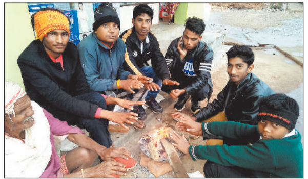
अलाव का सहारा लेते लोग।

इस बीच चुनावी शोरगुल में धान बिक्री को लेकर किसानों में भी ज्यादा उत्साह नहीं दिखा था, इसके बाद वे मौसम बरसात के कारण भी किसान धान की कटाई नहीं कर रहे थे, लेकिन अब बारिश थम जाने के बाद अब सोमवार से धान खरीदी में तेजी आई है। अधिकांश उपार्जन केन्द्रों में समर्थन मूल्य पर बिक्री के लिए धान लेकर किसान पहुंचने लगे हैं। इस महीने के अंत तक समितियों में धान की आवक बढ़ जाएगी।