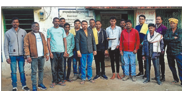
बलिदान दिवस मनाते महासभा के लोग।